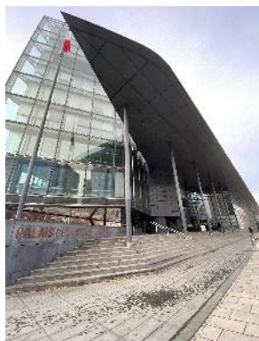
Le Palais de Justice de Grenoble